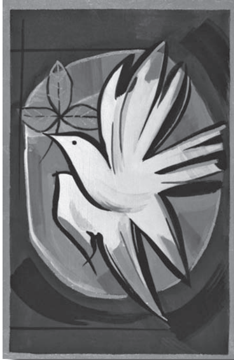
La colomba dello Spirito santo Atelier iconografico di Bose

Il dono della comunione è il primo dono della Pentecoste, e nello stesso tempo il fine supremo fissato da Cristo stesso a tutta l'umanità nella chiesa.